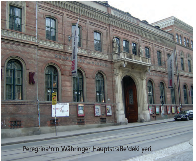
Peregrina'nın Währinger Hauptstraße'deki yeri.

Sever: Evet, tüm bayanlar karşılaştıkları sorunlar için her konuda bize gelebilirler. Sonuç olarak biz onlar için varız ve buradayız. Bizim varlığımızı ve onlara yardım etmek için burada bulunduğumuzu bilmeleri önemli tabii. 4083352 ve 4086119 nolu telefonlardan bize kolayca ulaşabilirler.