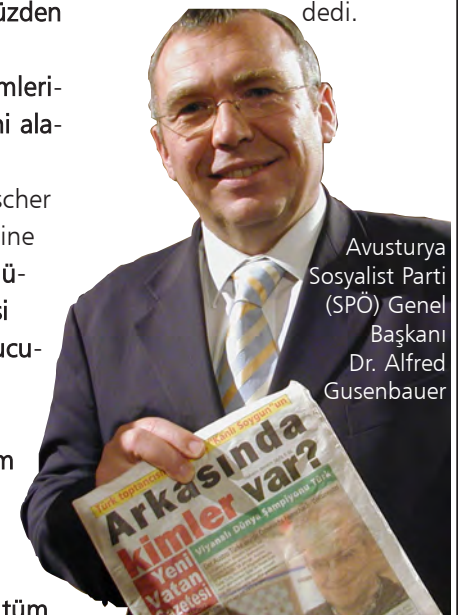
Avusturya Sosyalist Parti (SPÖ) Genel Başkanı Dr. Alfred Gusenbauer

temsilcilerine açıktır. Lütfen bu mesajımı özellikle iletin" dedi.