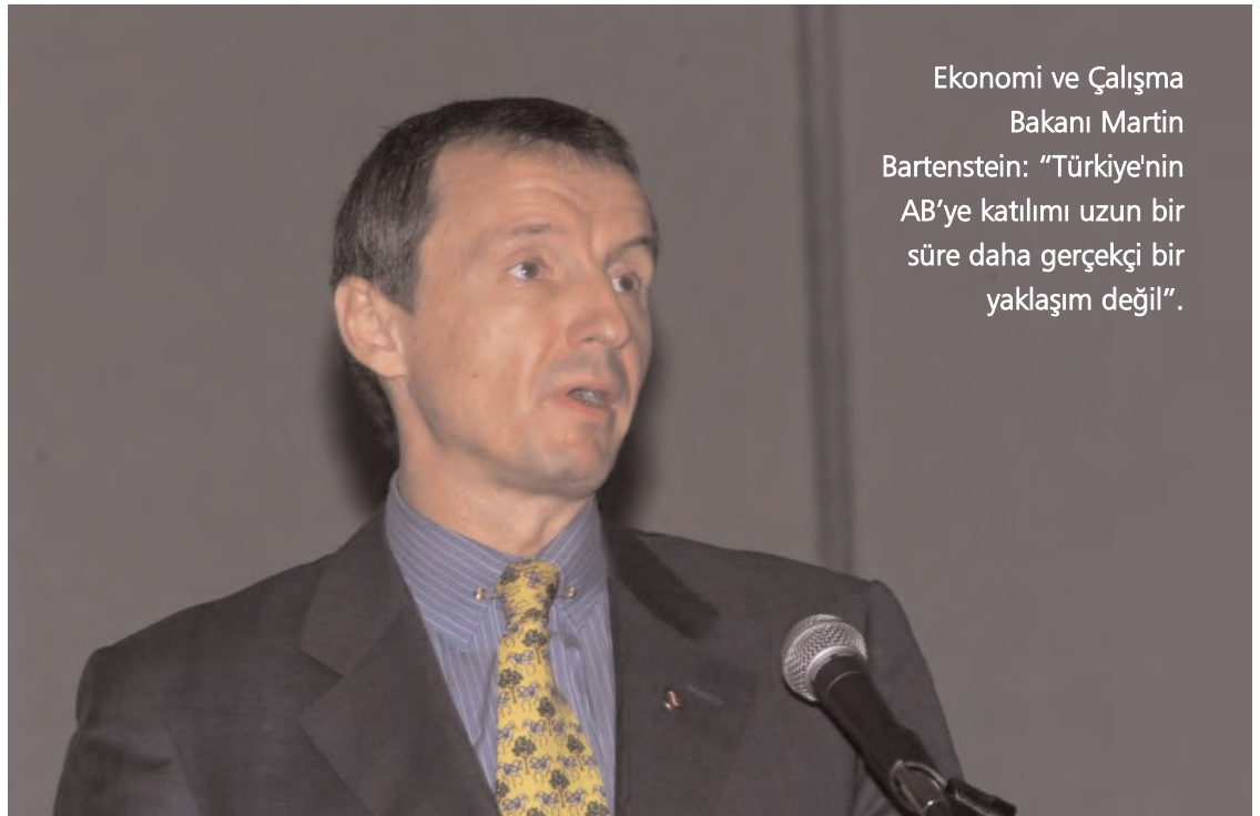
Ekonomi ve Çalışma Bakanı Martin Bartenstein: "Türkiye'nin AB'ye katılımı uzun bir süre daha gerçekçi bir yaklaşım değil".

Bartenstein Türkiye'nin AB'ye alınması halinde, "birkaç milyon Türk'ün" AB'ne çalışmak isteyeceğini belirterek, Türki-