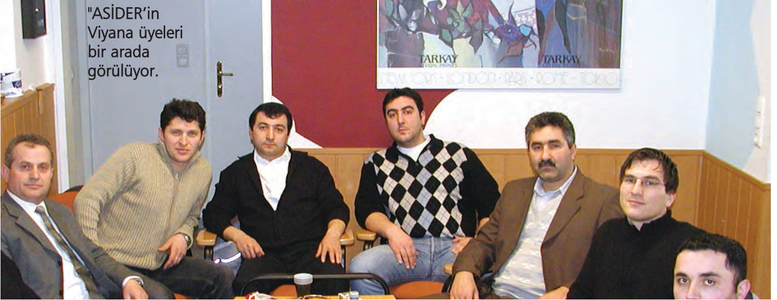
"ASİDER'in Viyana üyeleri bir arada görülüyor."

Viyana- Kısa adı "ASİDER" olan Avrupa Sinoplular Derneği'nin 2 sene önce başlattığı "Sinop Üniversitesi" inşaatı bitmek üzere. 1 Mayıs günü Viyana'da yapılacak olan şölen gelirleri, üniversitenin teçhizatına harcanacak.