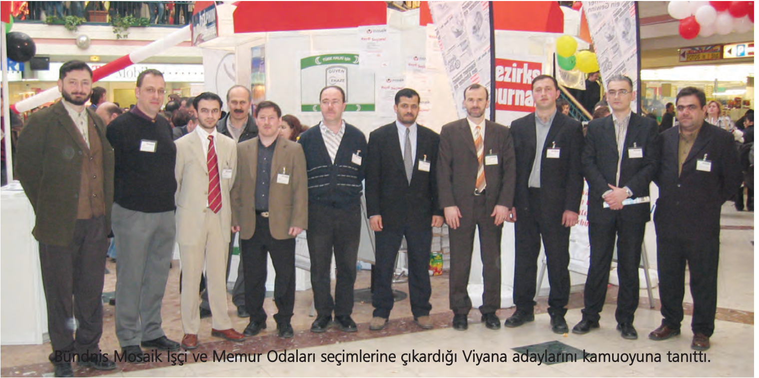
Bündnis Mosaik İşçi ve Memur Odaları seçimlerine çıkardığı Viyana adaylarını kamuoyuna tanıttı.

Viyana- Viyana eyaletinde 3 Mayıs - 14 Mayıs tarihleri arasında yapılacak olan İşçi ve Memur Odaları seçimleriyle ilgili olarak halkı bilgilendiren Bündnis Mosaik temsilcileri vatandaşlar ile görüşerek amaçlarını anlattılar. Viyana'daki seçimlere katılan 19 adayın isimleri tablodaki gibidir.