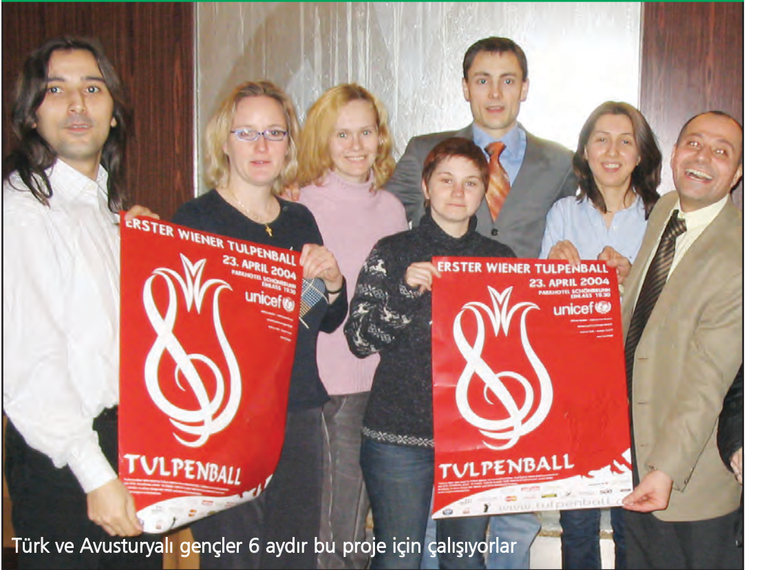
Türk ve Avusturyalı gençler 6 aydır bu proje için çalışıyorlar

Viyana'da 23 Nisan tarihinde, Avusturya ve Türkiye arasında her türlü siyasi ve politik olayın dışında, sadece dostluk ve zerafetin amaçlandığı "Viyana Lale Balosu" düzenlenecek. Viyana'da ilki yapılacak olan Lale Balosu'nun (Tulpenball) amacı, ülkeler arası ilişkileri güzel boyutlara taşımak. Organizasyonun aynı zamanda balolarıyla da ünlü olan Viyana şehrine, ayrı bir zenginlik katması daha da sevindirici. Balonun düzenlenmesinde pek çok