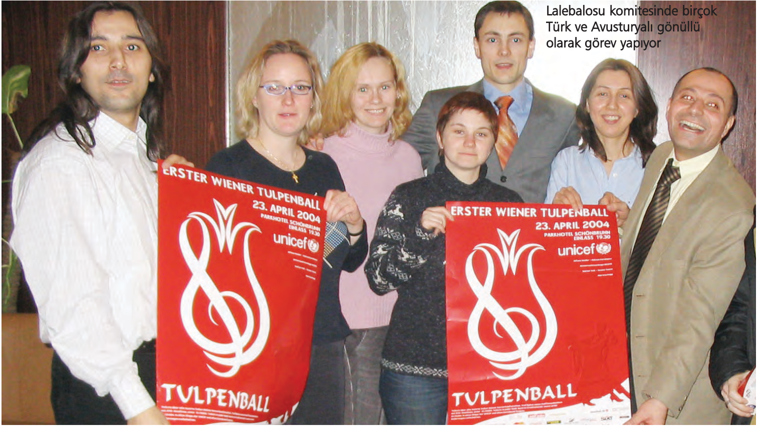
Lalebalosu komitesinde birçok Türk ve Avusturyalı gönüllü olarak görev yapıyor

Viyana- Bu sene Avusturya ve Türkiye arasında her türlü siyasi ve politik olayın dışında dostluk ve zarafetin ön planda tutulduğu bir olay gerçekleşiyor. Bu yıl ilki yapılacak olan Lale Balosu (Tulpen Ball) sadece ülkeler arası ilişkileri güzel boyutlara taşımakla kalmayacak, aynı zamanda balolarıyla da ünlü şehre ayrı bir zenginlik katacak.