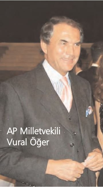
AP Milletvekili Vural Öğer

Almanya Sosyal Demokrat Partisi'nden Avrupa Birliği Parlamentosuna seçilen ünlü işadami Vural Öğer, Türkiye'deki zina ile ilgili tartışmalara istinaden yaptığı açıklamada "Men-subu bulunduğum Avrupa Parlamentosu bünyesinde Türk Ceza Yasası çerçevesinde başlayan zina konusundaki tartışmalarının, tam üyelik müzakerelerine başlama tarihinin ilanı öncesine rastlamasını, Türkiye - Avrupa Birliği ilişkileri adına büyük bir talihsizlik olarak görmekteyim. Zina tartışmaları Türkiye'ye büyük zarar veriyor" dedi.