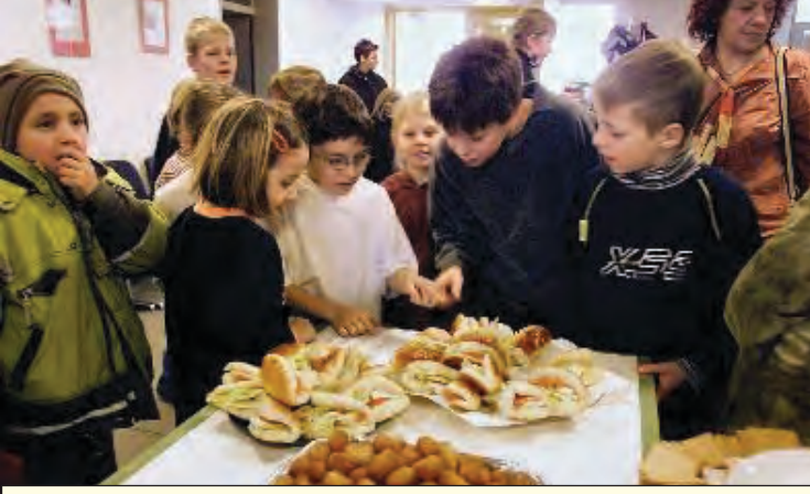
Yeni Vatan Gazetesi uyumdan sorumlu Viyana Eyalet Bakanı'na Türk çocuklarının uyumu ile ilgili sorunlar karşısında, programının ne olduğunu sordu.

lerinden dolayı, canı gönülden teşekkür ederiz. Türkler çok alçak gönüllü insanlardır biliyorum. Onların şu anda emeklilikteki sorunları, Viyana Eyaleti'nin sorunlarıdır. İkinci ve üçüncü kuşak Türklerin eğitimi, bizim için çok önemlidir. Viyana Eyaletinde özellikle küçük bakkal, sebze dükkanı sahibi, dönerci, kasap, lokanta türü işyerlerinin sahiplerinin Türkler olması beni mutlu ediyor. Onlar sayesinde hemen her köşe başında ben ve benim gibi on binlerce Viyanalı, alış-veriş yapıyor. Onlar sayesinde Viyana nefes alıyor, renkleniyor. Sabahları erkenden kalkıp taze ürünler için uzaklara giden bu küçük Türk işverenlerin sorunlarına kulağım, yüreğim ve kapım açıktır. Bugün bu zor ortamda işyeri ortamı yaratmak, bir Avusturyalı ile için bile zorken, hele Türkler için daha zordur. Bütün bu iş sahiplerini takdir ediyorum. Başarılar diliyorum." dedi. "Viyana Belediyesi'nde uzun yıllara dayanan tecrübemin, bu binada çalışan diğer parti gruplarındaki Viya-