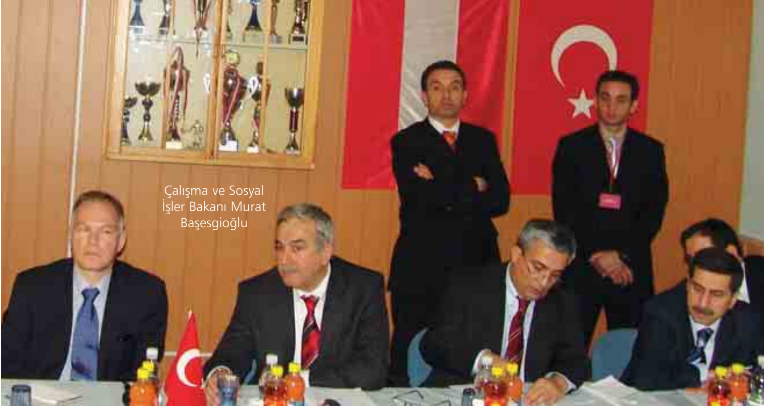
Çalışma ve Sosyal İşler Bakanl Murat Başesgioğlu