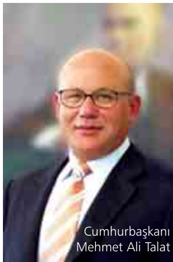
Cumhurbaşkanı Mehmet Ali Talat

Viyana- Cumhurbaşkanı Mehmet Ali Talat, Genç İşadamları Derneği yetkililerini kabulünde Kıbrıs konusundaki gelişmelerle ilgili açıklamalarda bulundu. Cumhurbaşkanı Mehmet Ali Talat, güçlenmiş bir devlet yapısının hem çözümsüzlük ortamında hem de çözüm şartlarında bir ihtiyaç olduğunu söyledi. Çözüm şartlarında birleşmenin dengeli bir şekilde olabilmesi için tarafların eşit koşullara sahip olması gerektiğini kaydeden Cumhurbaşkanı Mehmet Ali Talat, bunun Kıbrıs Türk halkının siyasi eşitliğini