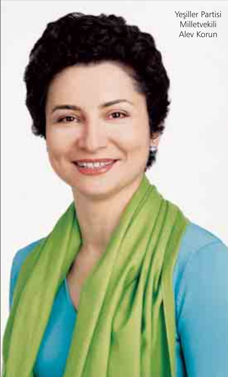
Yeşiller Partisi Milletvekili Alev Korun

Viyana- Yeşiller Partisi Milletvekili Alev Korun, belediye evlerinin yabancılara açılması konusunda işin peşini bırakmıyor. Aralık ayında yapılan Belediye Meclisi oturumunda, belediye evleri konusunda verdiği önerenin reddedilmesini ardından, 25-26 Ocak tarihlerinde yapılan Belediye Meclisi ve Meclis oturumlarında konuyla ilgili olarak üç önerge daha sunduğunu, fakat bu başvuruların yine başta SPÖ olmak üzere FPÖ ve ÖVP tarafından reddedildiğini açıkladı.