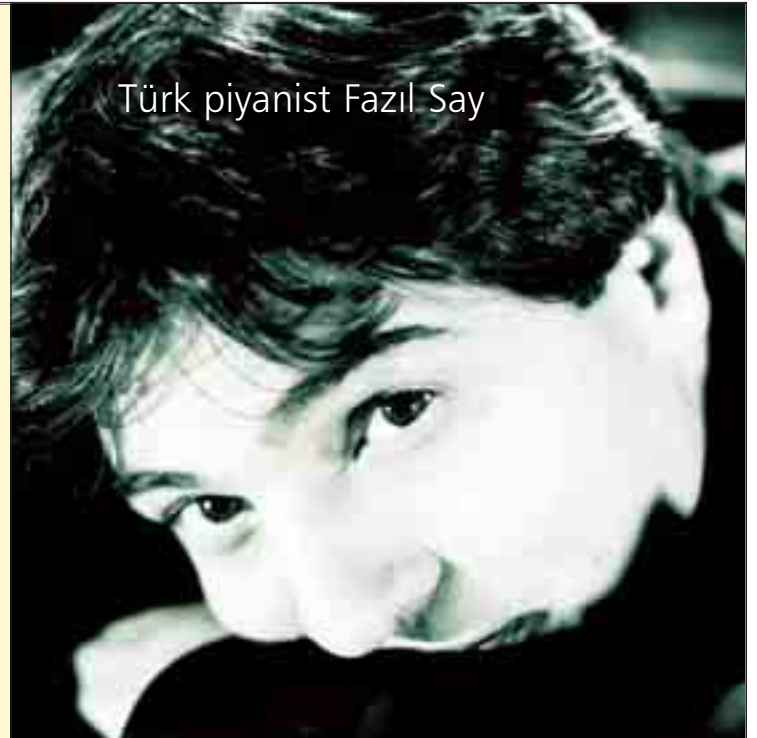
Türk piyanist Fazıl Say

Fazıl Say, 2006 Mozart yılında Viyana'da sahne almasıyla ilgili olarak "Mozart'ın eserleri benim için film müziği gibi ve dansla birleştiği zaman çok büyük bir enerji ortaya çıkıyor." dedi.