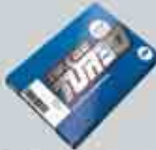
One Turbo Sim Card (içinde 5€ Guthaben)