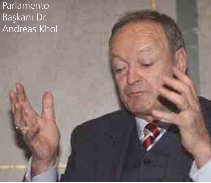
Parlamento Başkanı Dr. Andreas Khol

Viyana- Tüm Avrupa ülkelerinden gelen imamların katıldığı İslam Din Adamları Konferansı, 7 Nisan 2006 tarihinde Viyana'da başladı ve 9 Nisan 2006 tarihinde sona erdi. İslam delegeleri Avrupa Birliği'nden hakareti önleyici yasa talebinde bulundu. Avrupa İmamlar Konferansı'nın Cuma akşamı yapılan açılışında entegrasyon ve Hz. Muhammed karikatürlerinin yayınlanmasının yarattığı tartışmalarla ilgili olarak düşünce özgürlüğü konuları ön plandaydı. Avrupa Birliği Konsey Başkanı Federal Şansölye Wolfgang Schüssel bu bağlamda, Avusturya'da inanç grupları arasında hüküm süren