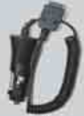
Araba Şarj Cihazı