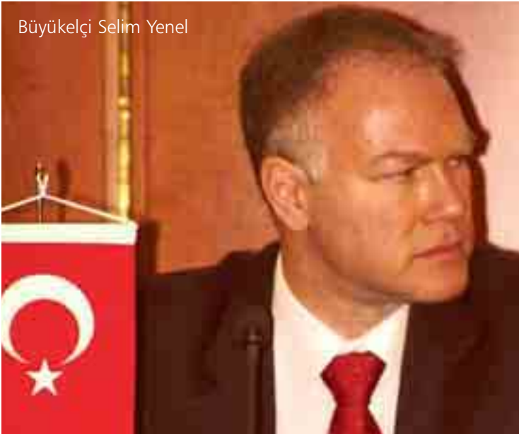
Büyükelçi Selim Yenel

ceğini zaten söyledi. Türkiye de referanduma gidip gitmemeyi düşünüyor." dedi. Yenel, AB'nin somut olarak neler getireceğini halka göstermek istediklerini ifade etti. OMV Gaz şirketi başkanı Otto Musilek ise, 5 milyar Euro'luk Nabucco-Gas-Pipeline projesinden ve Petrol Ofisi'nin %34'lük hissesini almalarından memnuniyet duyduklarını dile getirdi. Büyükelçi Selim Yenel, Nabucco Projesi için OMV'ye politik olarak tam destek verdiklerini ifade etti.