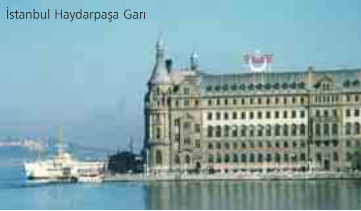
İstanbul Haydarpaşa Garı

İstanbul- Anadolu'dan İstanbul'a gelen milyonlarca insanın İstanbul'da ayak bastığı ilk yerdir Haydarpaşa Garı. Milyonlarca insan, trenden inen inmez şehrin silüetine burada şahit olur. Haydarpaşa Garı'na "şehirle ilk tanışma noktası" da denebilir. Yıllar önce İstanbul'a göç etmiş ya da trenle İstanbul'a gelmeyi seçmiş pek çok insanın hayatında önemli bir dönüm noktasıdır. Pek çok Türk filmi Haydarpaşa Garı'nda çekilmiştir. Buram buram tarih kokan Haydarpaşa Garı, yeni bir projeye bu niteliğini yitirme tehlikesiyle karşı karşıya. Hazırlanan proje kapsamında, gar