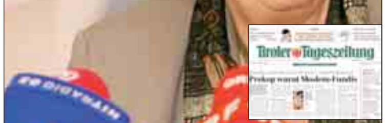
Avusturya İç İşleri Bakanı Liese Prokop

Viyana- Avusturya İç İşleri Bakanı Prokop Tiroler Tageszeitung'a verdiği demeç ile ortalığı karıştırdı. Prokop, İç İşleri Bakanlığının 500 Türk ve Müslümanı telefon ile arayarak elde ettiği bir araştırmaya istinaden, ülkedeki Müslümanların yüzde 45'inin uyuma eğilimli olmadıklarını öne sürdü. Fransa'daki gibi yabancı isyanı çıkmasından endişe ettiklerini belirten İç İşleri Bakanı Prokop, "Uyum sağlamanın bizim yanımızda işi yok.