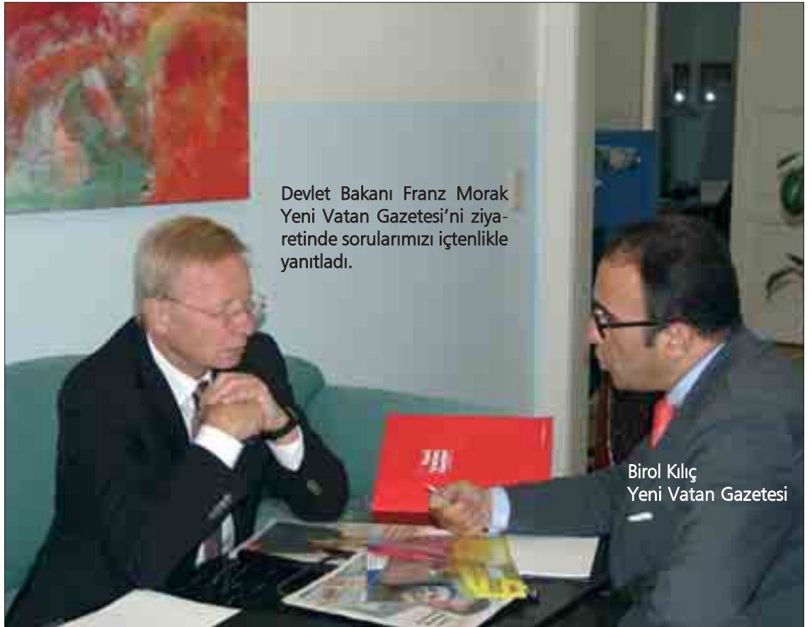
Devlet Bakanı Franz Morak Yeni Vatan Gazetesi'ni ziyaretinde sorularımızı içtenlikle yanıtladı.