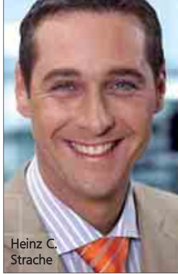
Heinz C. Strache

Avusturya Musevi Cemiyeti (IKG) Başkanı Ariel Muzicant bu açıklama nedeniyle bir uyarıda bulundu. Muzicant, gazetecilere, "FPÖ, aşırı sağcı kuruluşlarla devamlı ilişki içindedir" dedi. Muzicant, Honsik tarafından övülen FP milletvekili Rosenkranz'ın eşinin sorunlu geçmişi nedeniyle (söz konusu kişi, başka faaliyetlerinin yanı sıra aşırı sağcı dergi "Fakten"i yayımlamıştı) serbestçe "bodrum Nazisi" olarak nitelendirilebile-