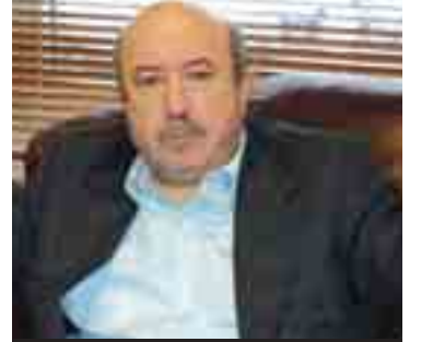
AKP'li Maliye Bakanı Unakitan'dan 15 YTL'lik harcı kaldırması bekleniyor.

Maliye Bakanlığı yetkilileri, çıkış harcına yönelik yeni düzenleme ile bir yandan 70 YTL'lik harç tutarını daha makul bir düzeye çektiklerini, bir yandan da harç ödemelerindeki eşitsizliğe son verdiklerini söylediler. Yurt dışı çıkış harçlarına ilişkin Kanun Taslağı ile çıkış harcının 15 YTL'ye düşürülmesine karşılık istisnalara son verilmesi, devletin buradan sağladığı kaynağı arttıracak. İstisnaların kaldırılmasıyla birlikte 8 milyon 250 bin kişiden 15 YTL çıkış harcı alınması halinde, Hazineye girecek para 123 milyon 750 bin YTL'ye yükselecek.