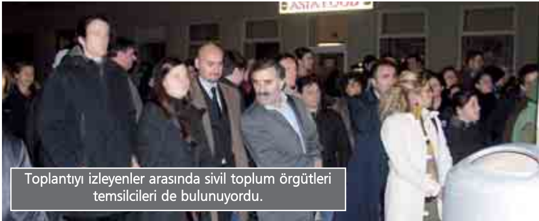
Toplantıyı izleyenler arasında sivil toplum örgütleri temsilcileri de bulunuyordu.

Fastenbauer, tüm dünyada bir an önce barışın hakim olmasını dilediklerini de söyledi.