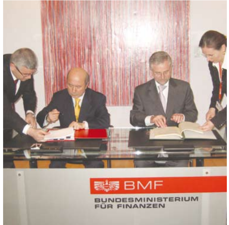
Maliye Bakanı Kemal Unakıtan

Türkiye'nin AB'e üyeliği konusunda, imtiyazlı ortaklık ile tam üyelik arasında bir karar verme aşamasında olduğu izlenimini edindiğini de söyledi.