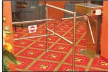
Giriş kontrol düzeni

Kayıt işleminden sonra oyuncuya üzerinde bir çip bulunan Novocard verilir, oyun alanının girişindeki turnike sadece bu kartla açılır. Uygunsuz olarak kullanılan veya kaybolan kartların kodu derhal iptal edilir.