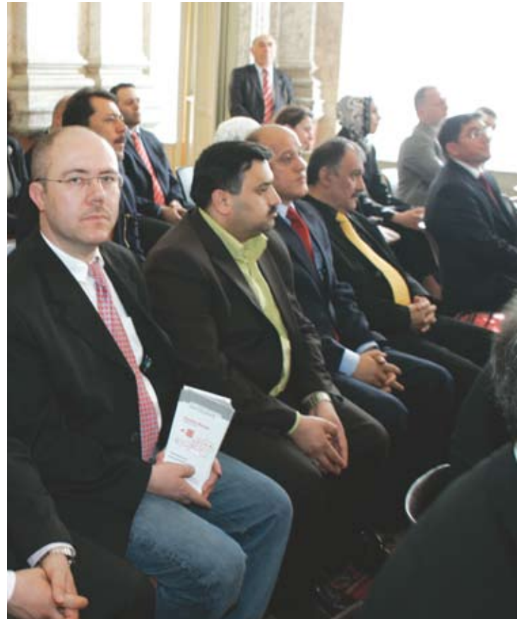
DIŞİŞLERİ BAKANİ BABACAN VE BUNDESRATH EFGANİ DÖNMEZ İLE DIPLOMATİK AKADEMİDE GÖRÜŞTÜ