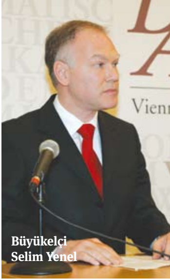
Büyükelçi Selim Yenel