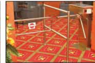
Giriş kontrol düzeni

Kayıt işleminden sonra oyuncuya üzerinde bir çip bulunan NOVOCARD™ verilir, oyun alanının girişindeki turnike sadece bu kartla açılır. Uygunsuz olarak kullanılan veya kaybolan kartların kodu derhal iptal edilir.