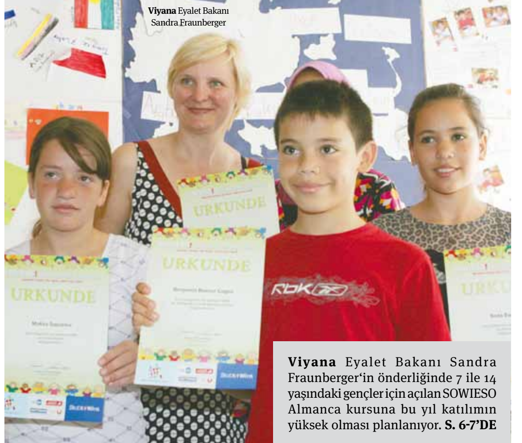
Viyana Eyalet Bakanı Sandra Fraunberger

Viyana Eyalet Bakanı Sandra Fraunberger'in önderliğinde 7 ile 14 yaşındaki gençler için açılan SOWIESO Almanca kursuna bu yıl katılımın yüksek olması planlanıyor. S. 6-7'DE