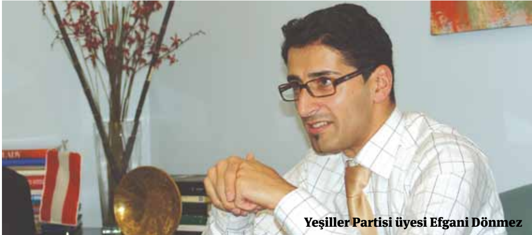
Yeşiller Partisi üyesi Efgani Dönmez

Amerika'nın bir çok eyaletini ziyaret eden Yeşiller Partisi'nden Efgani Dönmez, Avusturya basınındaki çıkışlarıyla tanınıyor. Dönmez, özellikle Yeşiller Partisi içinde yıldızı parlayan bir politikacı. Bu yüzden Avusturya'daki sorunları çok iyi biliyor. Bu sorunların çözümleri içinde çalışan Dönmez, entegrasyon ve entegrasyon politikaları konusunda uzman. Dönmez'in siyasi yaşamı çok başarılı. Çeşitli çevreler tarafından örnek olarak gösteriliyor.