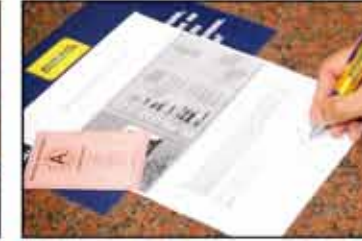
Kişisel bilgilerin kaydedilmesi

Otomat Salonu'na gelen her oyuncu, içeri girmeden önce kasada fotoğraflı yasal kimliğini gösterecektir. Oyuncunun erginlik yaşı kontrol edildikten sonra kişisel bilgileri skanner aracından geçirilip merkezi olarak yönetilen bilgisayara işlenir. Böylece Aşağı Avusturya'daki bütün Admiral Entertainment merkezlerinde bu verilerin kontrol edilmesi olanağı sağlanır.