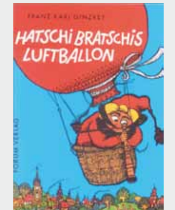
■ YENİ BASKI "Hacı Braci'nin Balonu" Forum Verlag

Ben hep bu kitabın sebepsiz bir iyimserlik barındırdığını düşündüm. Tabi ki bu hikayeyi okuyan küçük bir çocuğun yine de korkuya kapılması ihtimalini de unutmayalım. Ancak bu kitabı çocukların kendi kendilerine okuyup yazabildikleri bir dönemde çıkmak büyük bir sorun değil. İkinci tepkime gelirse de, politik doğruculuk penceresinden bakıldığında bu kitabın okunmasını doğru bulmuyorum.