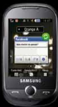
Samsung Corby S3650

Preis gültig bei Neuanmeldung in ausgewählter Tarif/Paket-Kombination. Bei Wahl der halben Grundgebühr gilt eine Mindestvertragsdauer von 36 Monaten, bei halber Vertragsdauer eine Mindestvertragsdauer von 12 Monaten. Details zu den Tarifen auf orange.at/tarife