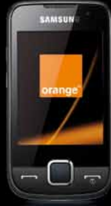
Samsung Samsung S5600

Touchscreen, TouchWIZ Oberfläche, 3-Megapixel-Kamera MP3-Player, Hülle mit FHD, Bluetooth, MULTIMEDIA 60 MB Speicher (SD für MicroSD-Card bis 4 GB)