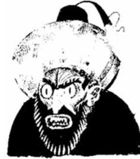
■ HACI BRACI , Ernst von Dombrowski'nin 1933 yılından kalan Hacı Braci tasviri "Oriental" olanı resmediyor: Yahudi değilse kesin Türk'tür. Türk ise de Hacı Braci'dir.