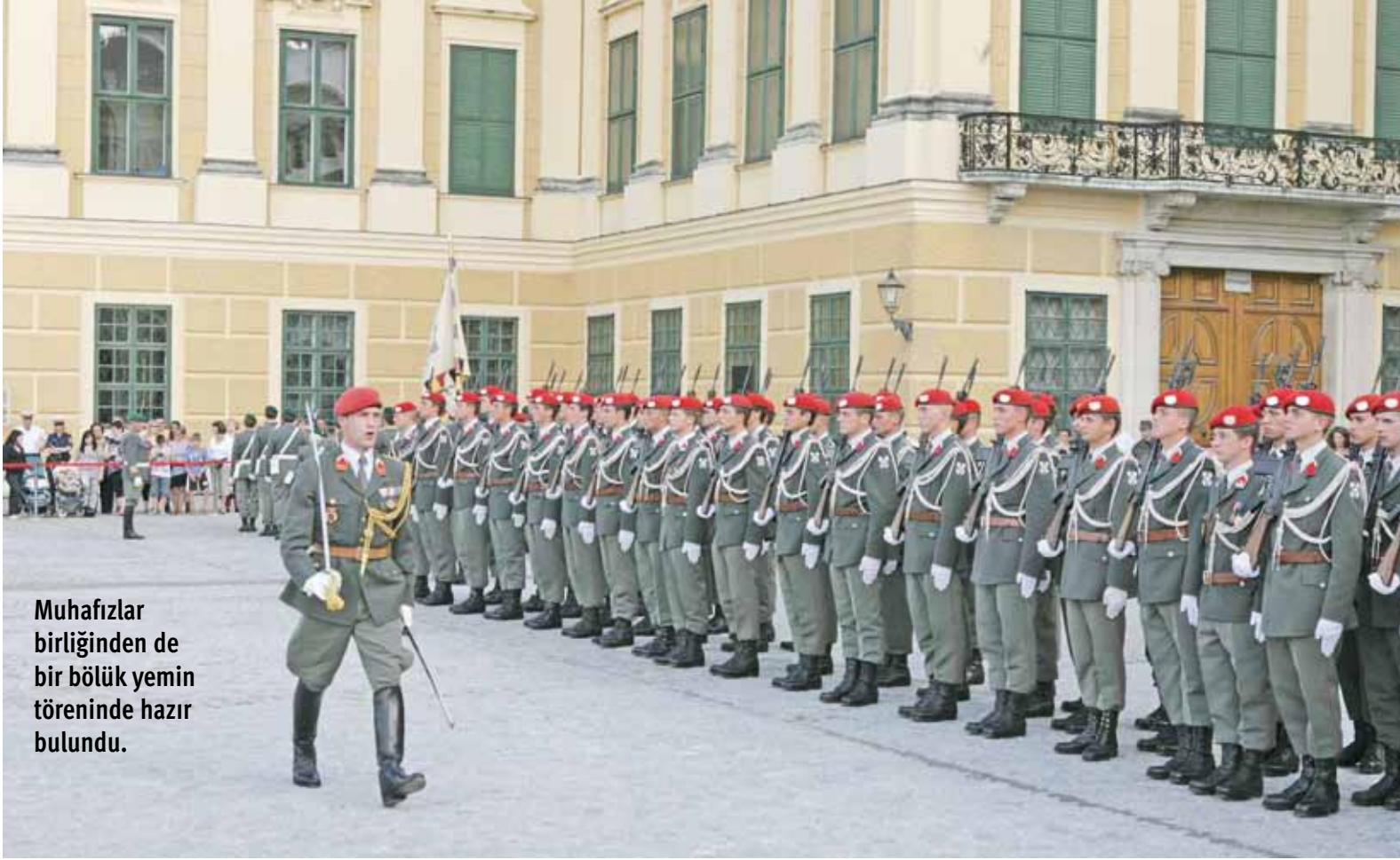
Muhafızlar birliğinden de bir bölük yemin töreninde hazır bulundu.