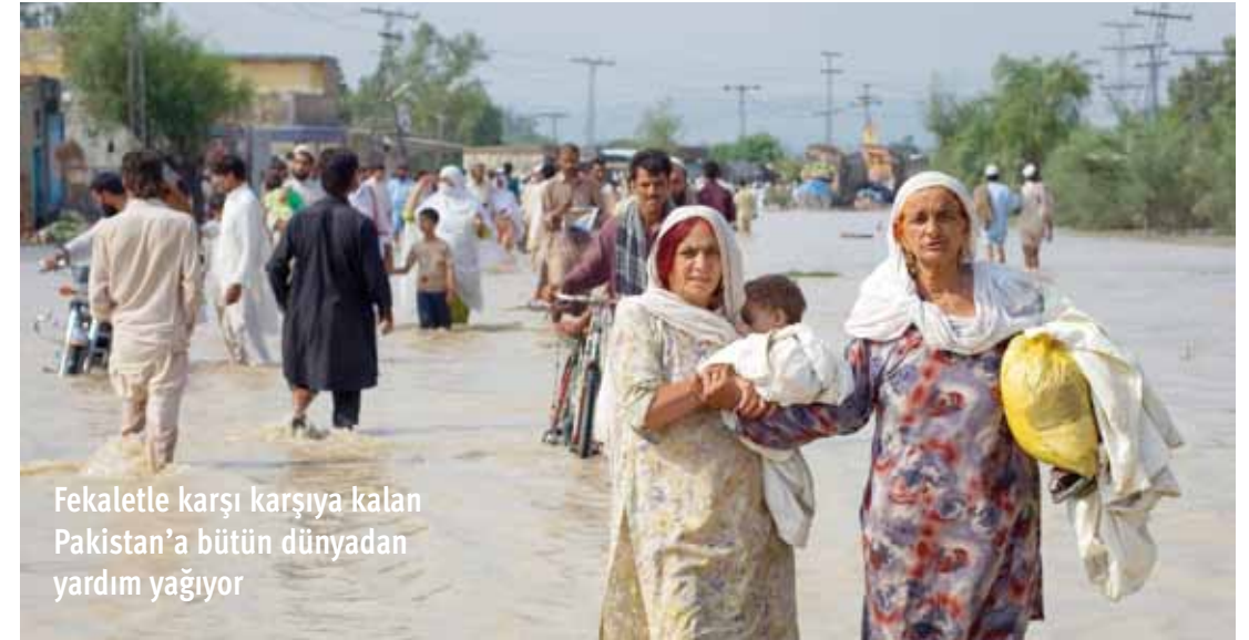
Fekaletle karşı karşıya kalan Pakistan'a bütün dünyadan yardım yağıyor

Pakistan Ulusal Sağlık Kurumu, kirli suların etkisiyle ishal ve kolera salgını oluşmasının önlenmesi için herkesi uyardı. Kurum, afet bölgelerindeki çocuklarda görülen ateşli hastalık ve ishal oranında endişe verici oranlara ulaşıldığını açıkladı.