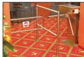
Giriş kontrol düzeni