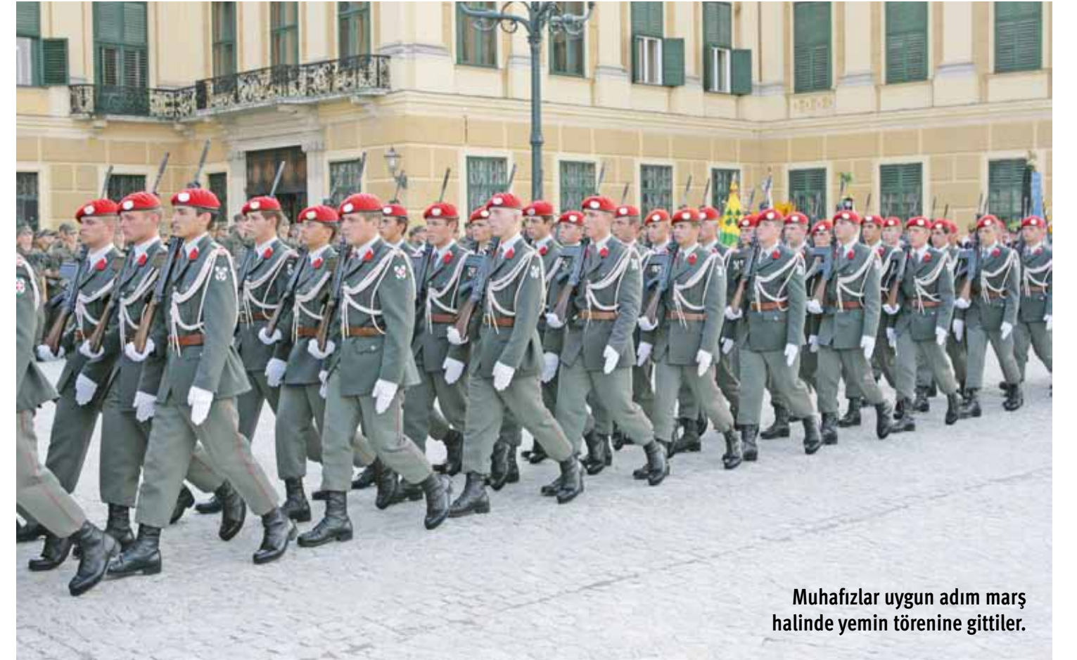
Muhafızlar uygun adım marş halinde yemin törenine gittiler.