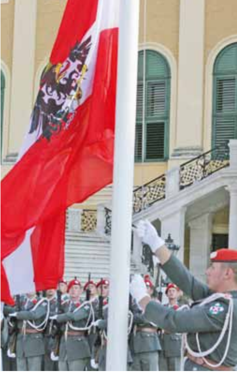
Vorbildliche Austrotürken im Österr. Bundesheer