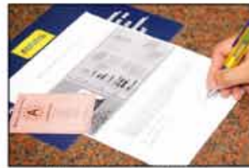
Kişisel bilgilerin kaydedilmesi

Otomat Salonu'na gelen her oyuncu, içeri girmeden önce kasada fotoğraflı yasal kimliğini gösterecektir. Oyuncunun erginlik yaşı kontrol edildikten sonra kişisel bilgileri skanner aracından geçirilip merkezi olarak yönetilen bilgisayara işlenir. Böylece Aşağı Avusturya'daki bütün Admiral Entertainment merkezlerinde bu verilerin kontrol edilmesi olanağı sağlanır.