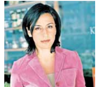
Yeşiller Başkanı Maria Vassilakou SPÖ ile koalisyona gitmek istiyor

EĞİTİM: Yeşiller eğitim konusuna önem veriyor. Çocuk yuvalarının da çok dilli olması taraftarları: 'Çocuk yuvaları çok dilli olmalı. Göçmen çocuklar hem anadillerini hem de Almanca'yı çok iyi konuşmalı. Avusturyalı çocuklar da anaokulunda bir yabancı dil öğrenmeye başlamalı'.