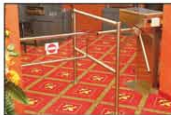
Giriş kontrol düzeni