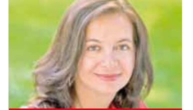
Ulli Sima Umwelt

Şehir meclisinde çoğunluğun sağlanması için salt çoğunluğa ihtiyaç vardır, ve onların yüzde 46'sı salt çoğunluk olarak kabul görülür.