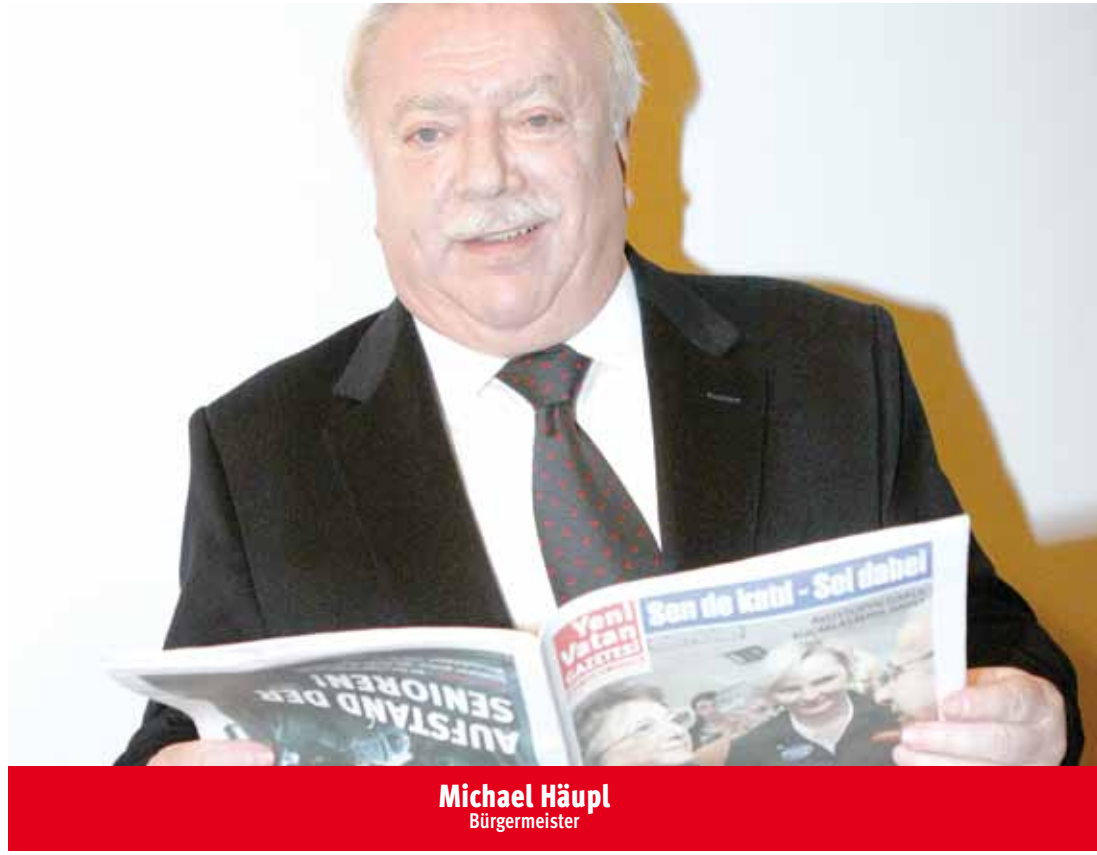
Michael Häupl Bürgermeister

Koalisyon görüşmeleri sonlandı, SPÖ-Grüne koalisyonu kuruldu ve Viyana'nın yeni eyalet meclisi ilk toplantısını gerçekleştirdi. İşte yeni eyalet meclisi ve meclisteki yeni yüzler.