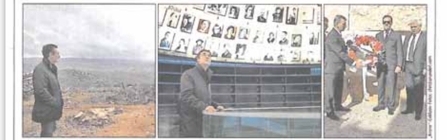
Strache nicht ins Jordantal, besucht die Holocaust-Gedenkstätte und legt für die Opfer der Shoah einen Kranz nieder

Donnerstag, 9. Dezember 2010 POLITIK Seite 5