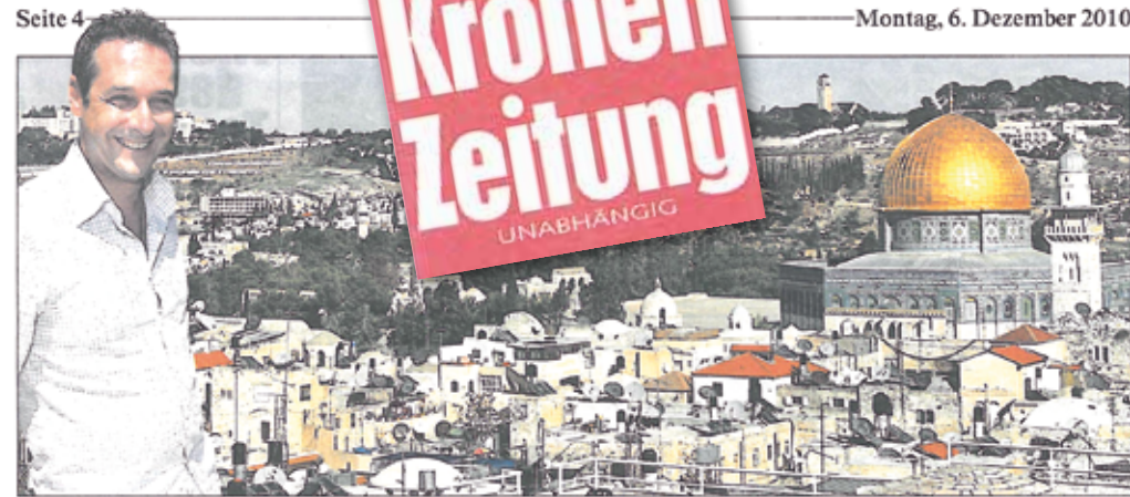
Für drei Tage befindet sich Strache im Heiligen Land, um mit israelischen Rechtspolitikern über islamistischen Fundamentalismus zu reden

FPÖ-Chef auf Israel-Reise: „Ich habe viele Gemeinsamkeiten mit Theodor Herzl“