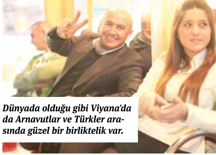
Dünyada olduğu gibi Viyana'da da Arnavutlar ve Türkler arasında güzel bir birliktelik var.

Viyana'da uzun zamandan beri yaşıyorum. Birçok Türk arkadaşım var. Türkler güzel insanlar. Tarihi ve dini birliğimiz var. İki halk kardeşir" dedi.