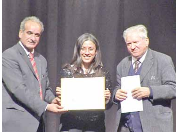
Dünya İnsanı Birliği Derneği Beşinci Ödülü Bu Yıl Maria Vassilakou ve Mikis Theodorakis'e Verildi.