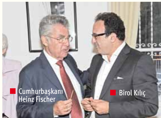
Cumhurbaşkanı Heinz Fischer

Cumhurbaşkanı Fischer'in de gelişmeleri yerinde takip etmek adına Efes'i ziyaret eden isimlerden biri olması dikkat çekti.