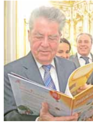
■ Cumhurbaşkanı Fischer de beğendi.

Yeni Vatan Gazetesi, Neue Welt Verlag adlı yayınevi ile birlikte Avusturya'da yine bir ilki gerçekleştirerek hazırladığı büyük resimli Avusturya Almancası-Türkçe sözlüğünün yeni ve geliştirilmiş ikinci baskısını 30 bin baskı ile piyasaya sürdü. Avusturya Eğitim Bakanlığı'nın onay verip tavsiye ettiği kitaplar listesine giren sözlük için siparişler gelmeye başladı. Kitap, hem okullardan hem de kitapçılardan sipariş edilebilir.