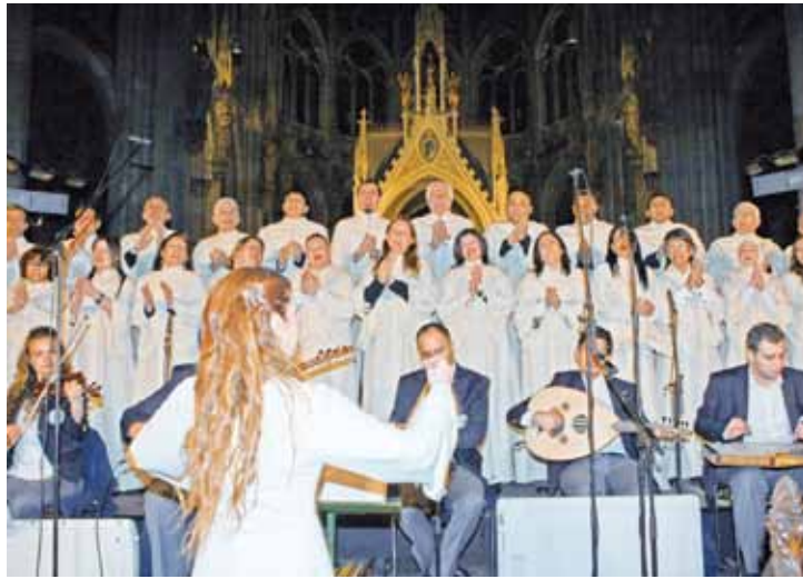
■ Antakya Medeniyetler Korosu 2012 Nobel Barış Ödülü'ne aday oldu

Müslüman, Yahudi ve Hıristiyan dinlerine mensup yüz yirmi kişiden oluşan, şarkılarla dinler, mezhepler, kültürler arasında kurdukları diyalog kuran Antakya Medeniyetler Korosu dünya barışına yaptıkları katkıdan ötürü 2012 Nobel Barış Ödülü'ne aday gösterildi.