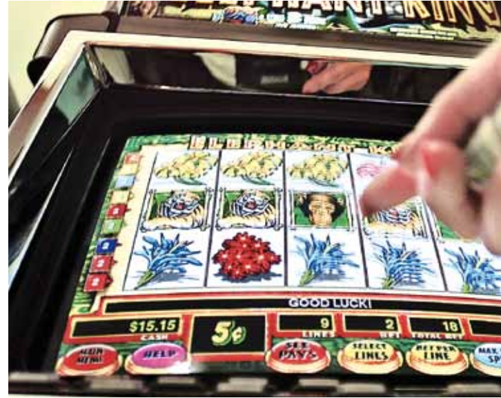
■ Avusturya'da 60 bin kişi kumar bağımlısı, 340 bin kişinin alkol problemi var.

resmi olarak 700 bin kişi çevresinde ve kendi yaşamında alkol ile problem yaşıyor; 340 bin kişi ise kronik alkol bağımlısı. Yine resmi rakamlara göre Avusturya'da 60 bin kişi kumar bağımlısı. Çoğu 18-30 yaş arasından olmak üzere Avusturya'da resmi olarak 37 bin uyuşturucu bağımlısı olduğu da araştırmanın ortaya koyduğu sonuçlar arasında.