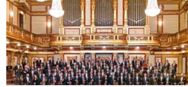
■ Dünyanın en ünlü orkestrası Viyana Filarmoni'den Efes Antik Kenti'nde konser

Dünya Kültür Mirası Listesi'ne aday Efes Antik Kenti 10 Temmuz akşamı Avusturya'nın ve dünyanın en önemli orkestrası olarak kabul edilen Viyana Filarmoni'yi ağırladı.