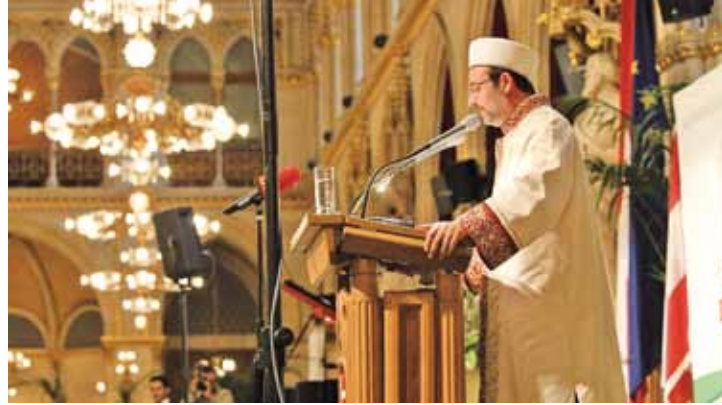
■ T.C. Diyanet İşleri Başkanı Mehmet Görmez Wiener Zeitung gazetesine verdiği röportajda "Kimsenin İslam adına konuşma yetkisi yoktur" dedi.

Mehmet Görmez: Diyanet, İslam'ın dinsel ve ahlaksal prensiplerini araştırmak için kurulmuştur. Bazen farklı bir izlenim yaratsa da, Diyanet belli bir mezhebe ya da İslami yönelime ait değildir. Biz tüm yönelimlere açık olamaya çalışıyoruz ancak Türkiye için tipik olan bir İslam anlayışı var mı diye sormak gerekiyor. İnancın temelleri anlamında bir farklılık yok, sadece farklı yorumları ve farklı uygulamaları var. Tabii Türkiye'de Osmanlı ge-