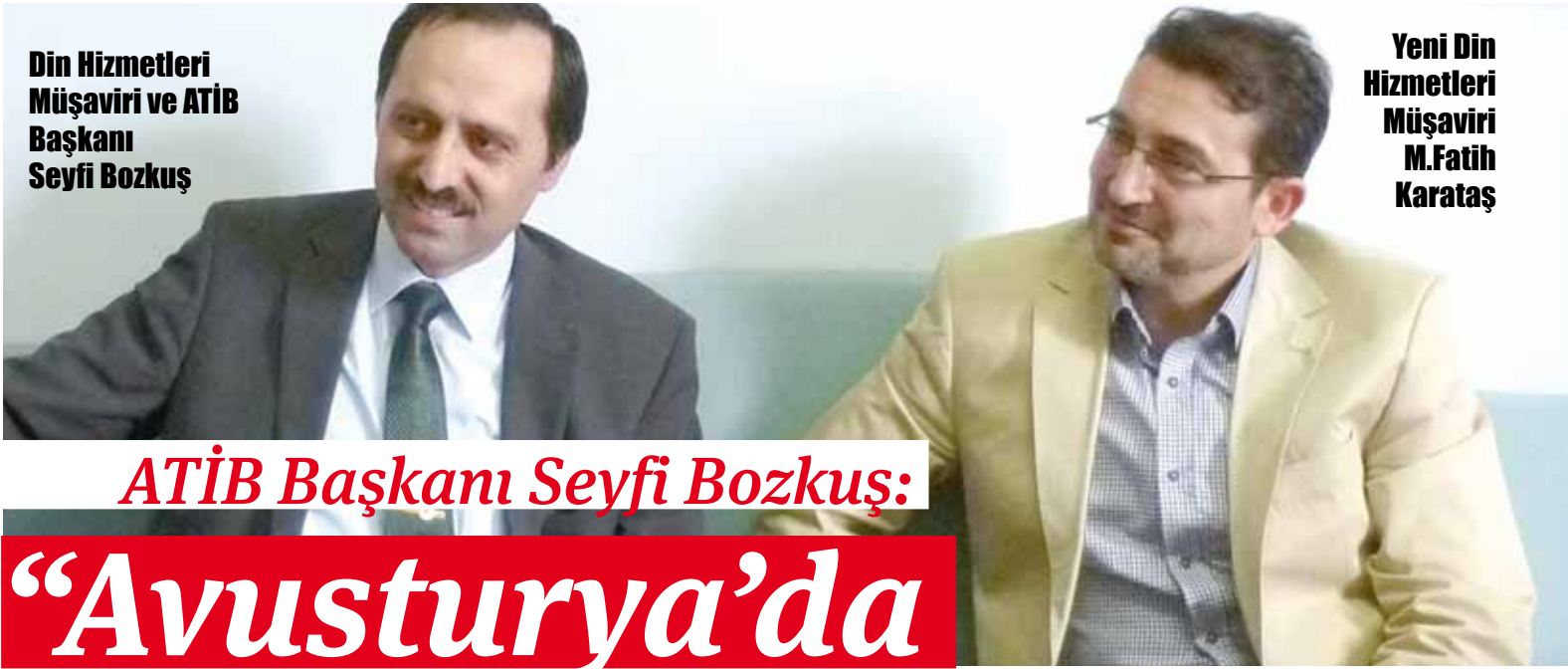
Din Hizmetleri Müşaviri ve ATİB Başkanı Seyfi Bozkuş