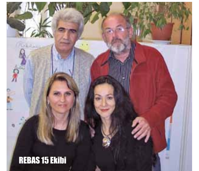
REBAS 15 Ekibi

Bizi en çok uğraştıran değil de, en çok canımızı sıkan zorunlu eğitimini bitirdikten sonra Avusturya’ya göçen yeni gençler, yani 15 yaş üstü diyebiliriz. Bu yaş grubu ile maalesef REBAS ilgilenmiyor, biz sadece 15 yaşa kadar olan çocuklarla ilgileniyoruz, ancak bize danışanlardan anladığımız budur. Bu yaştaki çocukları okullar Almanca’yı olmadığı için alamıyorlar. Bu gençlerin lise veya dengi düzeyde eğitimlerine devam etmeleri için Almanca öğrenmeleri gerekiyor, öğreniyorlar ancak bu sefer de okullar onları nereye yerleştireceğini bilemiyor, şanslı olanlar özel okullara gidiyorlar. AMS’in ortaokul bitirme kurslarına gidenler oluyor ama bu gençlerin Avusturya’da yüksek öğrenim şansları çok az oluyor. En az 2-3 sene kaybediyorlar. Zaten birçoğu da pes ediyor. Bizim tavsiyemiz kesinlikle Türkiye’de lise ikinci veya üçüncü sınıfta okuyan çocuğun burada getirilmemesi. O çocukların burada yaşamları bitiyor. Liseyi bitirsinler, hatta mümkünse Türkiye’de üniversite sınavından da herhangi bir yere yerleşecek puanı alsınlar, öyle gelsinler buraya. Ondandır önleri açık. 14-17 yaş arası gençleri buraya getirmek gençlerin geleceği açısından çok tehlikeli.