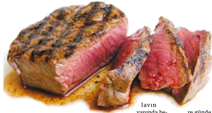
lavın yanında beyaz ekmekten de