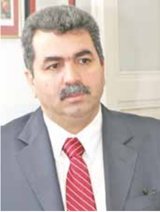
AYFED ile röportaj “Riyakar temsilci istemiyoruz” S. 8