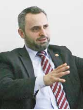
TÜMSIAD Avusturya ile röportaj “Tabela derneği değiliz” S. 16-17

YENİ VATAN GAZETESİ / NEUE HEIMAT ZEITUNG / MAYIS / MAI 2013 / AUSGABE 145 / KOSTENLOS / P.B.B. VERLAGSORT 1010 WIEN / PLUS.ZEITUNG 102038438P / 01 513 76 15 - 0 / office@yenivatan.at AUFLAGE / BASKI ADEDİ: 50.000 STÜCK/ADET