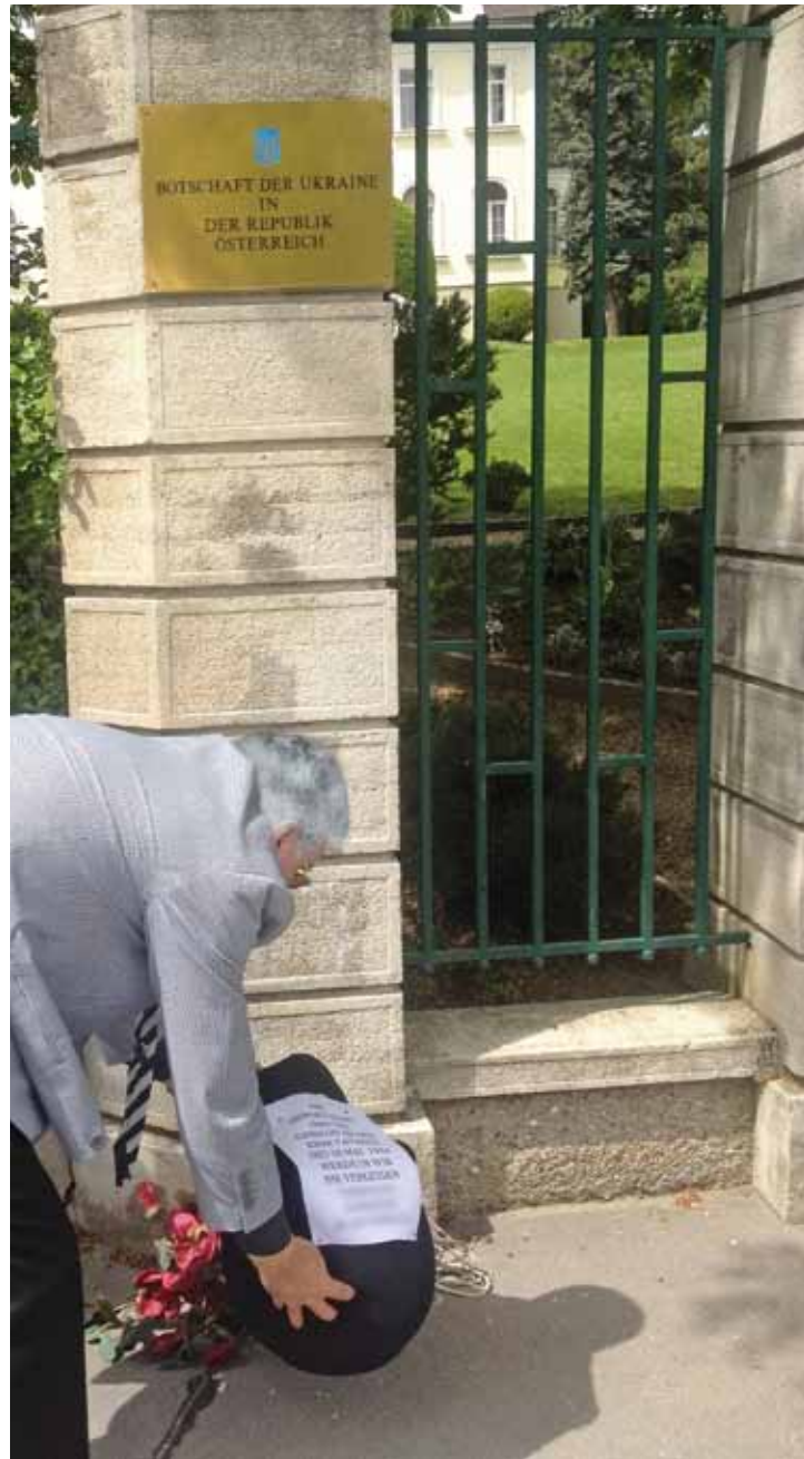
■ Viyana, Ukrayna Büyükelçiliği önü, 18 Mayıs 2013, saat 11:00

Başta Ukrayna'nın Kırım Cumhuriyeti olmak üzere Avrupa'da ve Türkiye'de, Kırım Türklerinin sürgüne gönderilişinin 69. yıldönümü büyük bir yasla ve protestolarla anıldı. 18 Mayıs günü, Avusturya Türk Kültür Cemiyeti de Viyana'da Ukrayna Büyükelçiliği önüne siyah çelenk bıraktı.