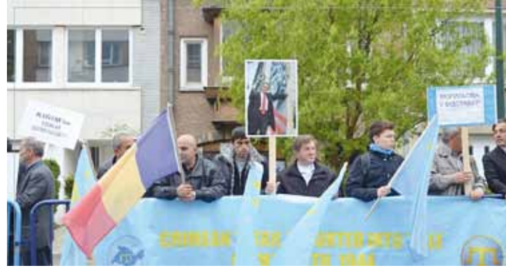
■ Brüksel, 18 Mayıs 2013, saat 11:00

Başta Ukrayna'nın Kırım Cumhuriyeti olmak üzere Avrupa'da ve Türkiye'de, Kırım Türklerinin sürgüne gönderilişinin 69. yıldönümü büyük bir yasla ve protestolarla anıldı. Avrupa Kırım Kültür ve Dayanışma Merkezi, Brüksel, Paris, Berlin, Den Haag ve Viyana'da düzenlediği anma törenlerinde Kırım Türkleri'nin uğradığı sürgün ve soykırımı protesto etti.