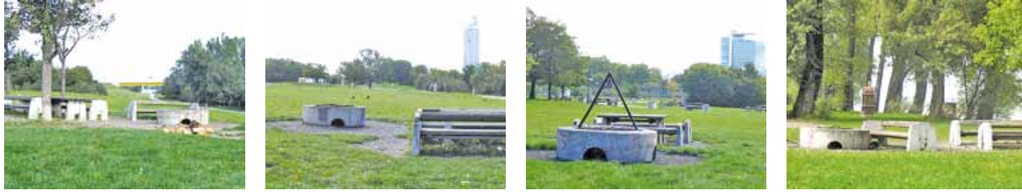
■ TUNA ADASI (DONAUINSEL) Bölgesi - ızgara yapma yerleri Donanım: Masa ve banklar, sabit beton ızgara yerleri.

Havaların ısınmasıyla birlikte Türkiye göçmenlerinin vazgeçilmez klasiği olan ızgara için Viyana Belediyesi yer gösteriyor. Bazı yerler için ise önceden rezervasyon yaptırmak gerekiyor. Telefon: (+43 1) 4000 96496