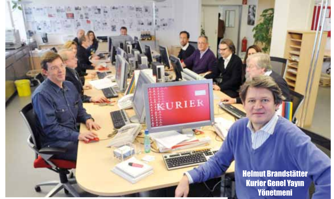
Helmut Brandstätter Kurier Genel Yayın Yönetmeni

İnsanların gettolarla yaşamasını istemiyoruz. Türkiye göçmenleri ve Avusturya'da yaşayan herkesin arasında karşılıklı anlayış, sevgi ve saygıya dayalı bir diyalogun olması hepimiz için en iyisi. Dileğimiz Türkiye göçmeni Avusturyalıları eğitim piramidinde daha üst seviyelerde görmektir, çabalarımız da bu yöndedir. Onların daha eğitilmiş olmaları, meslek sahibi olmaları, üretme-