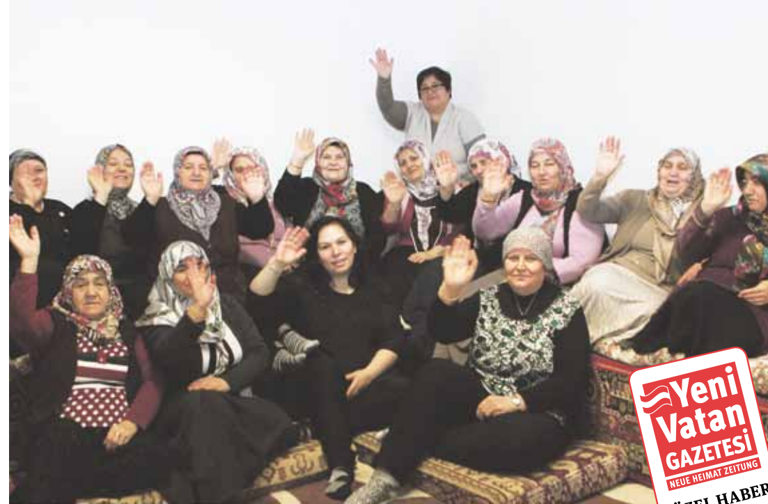
Yeni Vatan Gazetesi Viyana'da yaşayan Sivas Sızırli vatandaşlarla derneklerinde görüştü.