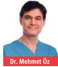
Dr. Mehmet Öz