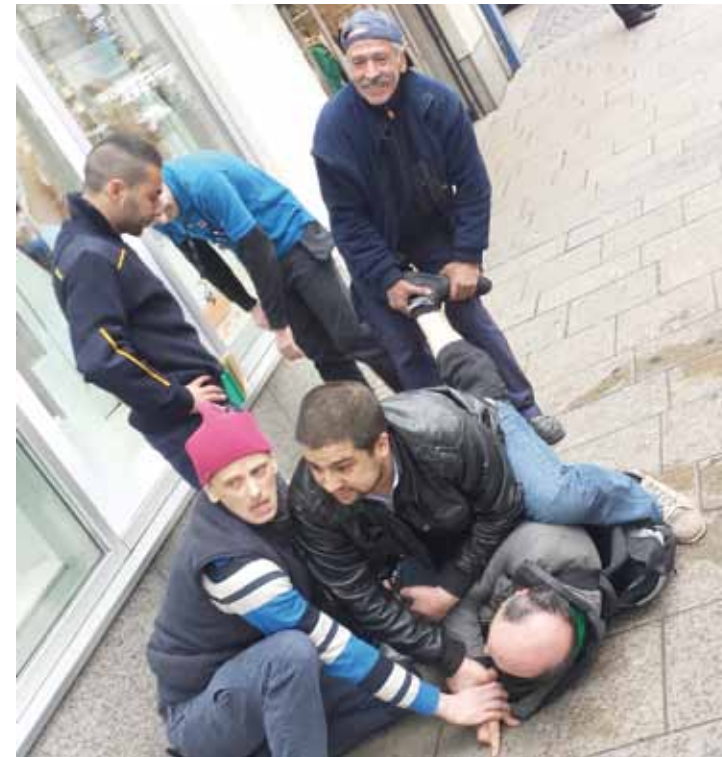
Hırsızın yakalanmasını sağlayan esnaf ve çevredeki vatandaşlar, yorulunca aralarında nöbet değişimi yaptı.