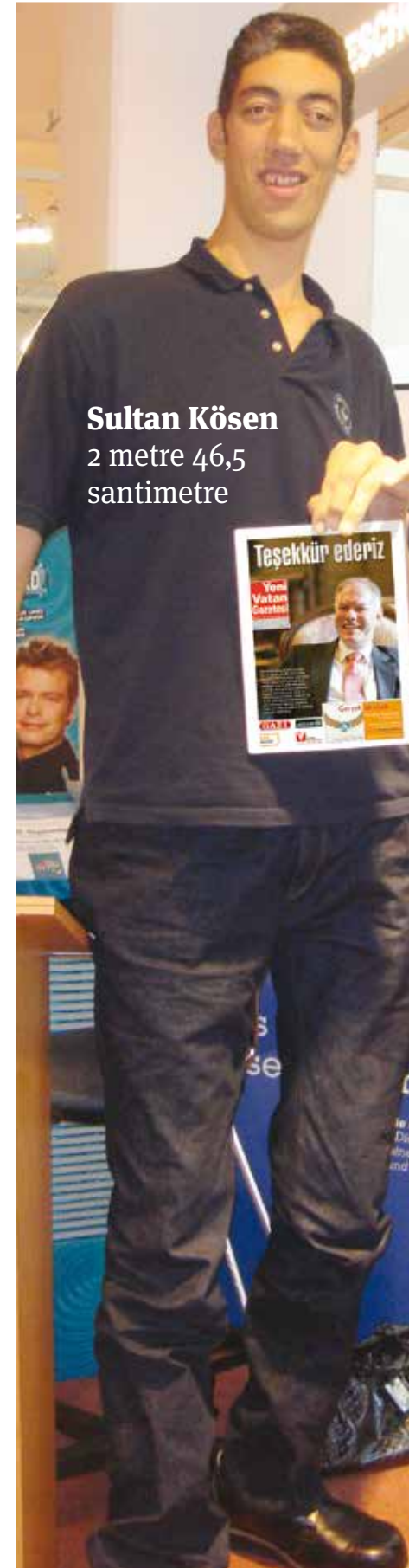
Sultan Kösen 2 metre 46,5 santimetre