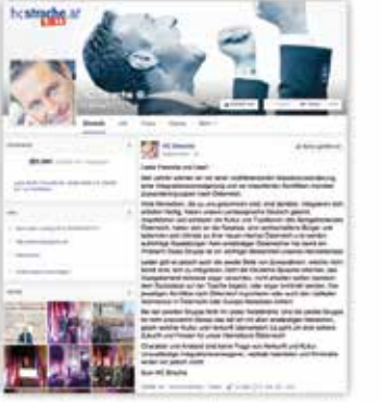
HC Strache, FPÖ Başkanı

Bu mesajın içeriği, özellikle de Türkiye'den gelen göçmenlere karşı saldırganlıkta bulunan misilsizlerle ilgili geri adım atılmamış olduğunu belirtmiş. Fakat FPÖ bu mesajında kimleri eleştiriyor? Yeni Vatan Gazetesi 1999 yılından bu yana FPÖ partisini en sert eleştiren ve eleştirecek yerel gazete olarak okuyucularına sayıdaki gereği bu mesajı duyurmayı bir habercilik görevi olarak görmektir. İşte FPÖ liderinin Facebook sayfasında 221 bünden fazla arkadaş ile paylaşıldığı mesajın Türkçe tercümesi.