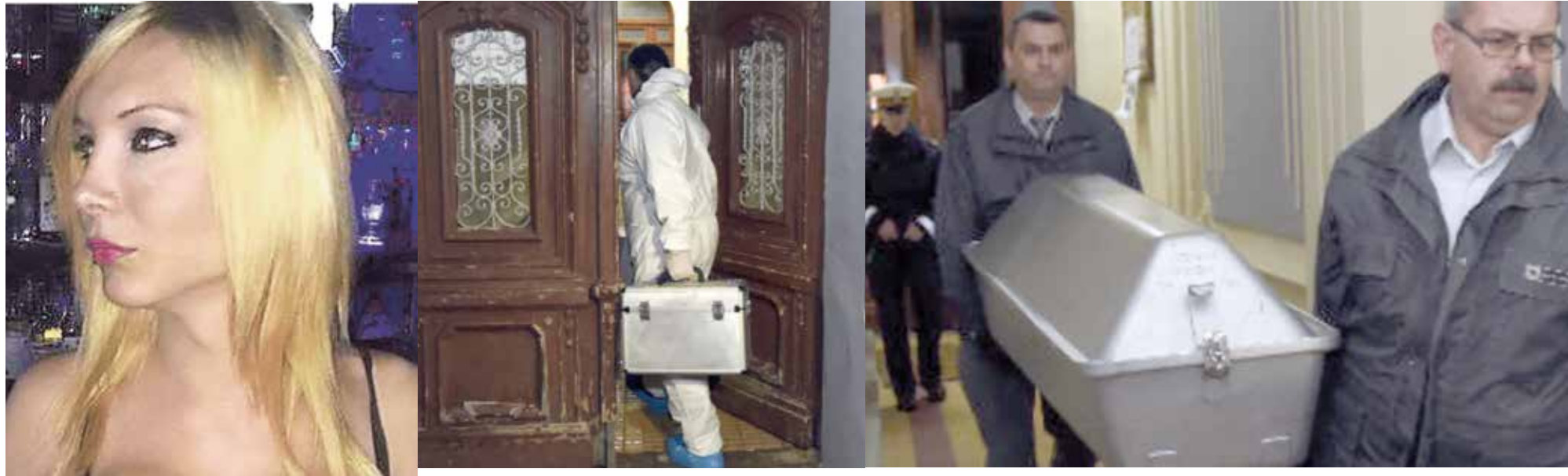
Viyana'da bir ceset bulundu. Katil aranıyor. Arkadaşı üzgün: