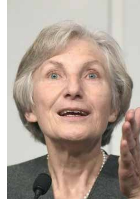
Irmgard Griss (Bağımsız)