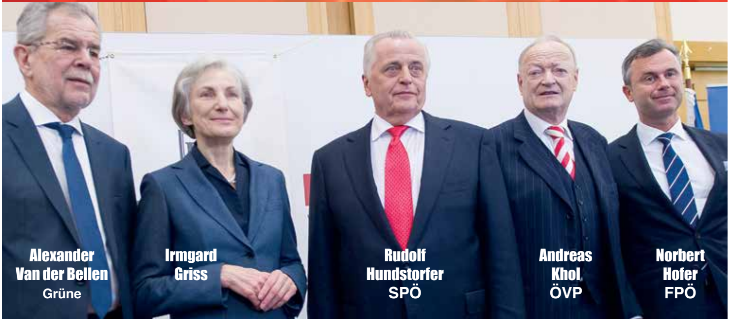
Alexander Van der Bellen Grüne