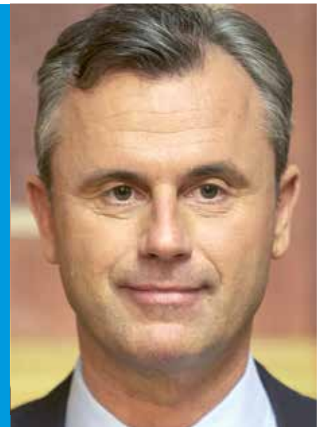
Norbert Hofer FPÖ