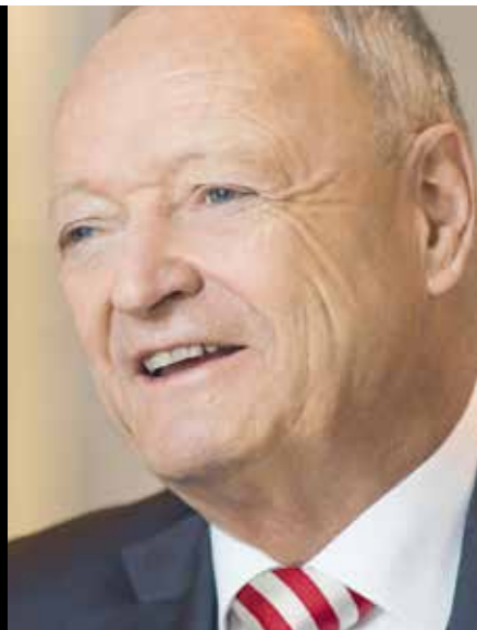
Andreas Khol ÖVP