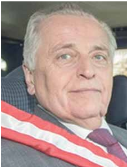
Rudolf Hundstorfer SPÖ