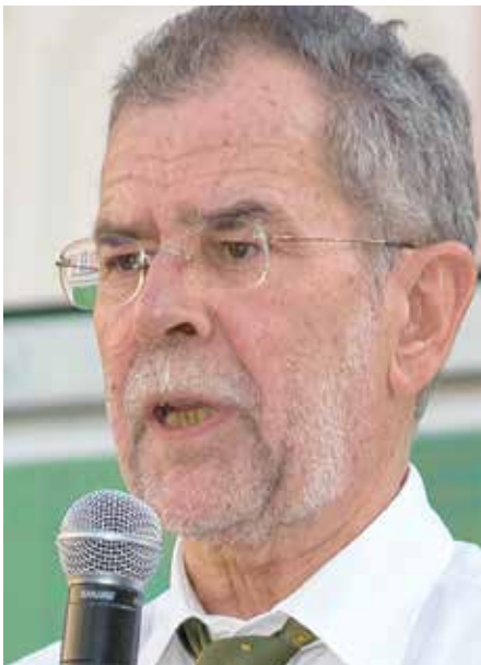
Alexander Van der Bellen Grüne