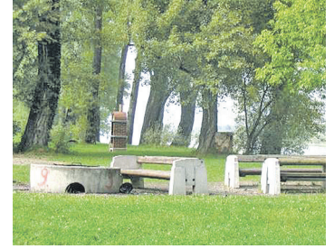
■ TUNA ADASI (DONAUINSEL) bölgesi - ızgara yapma yerleri Donanım: Masa ve banklar, sabit beton ızgara yerleri.