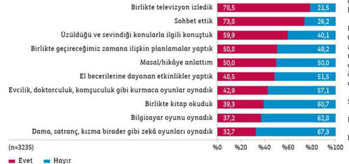
Şekil 5. Son bir ay içinde çocuğunuzla aşağıdakilerden hangilerini yaptınız? (0-10 yaş)