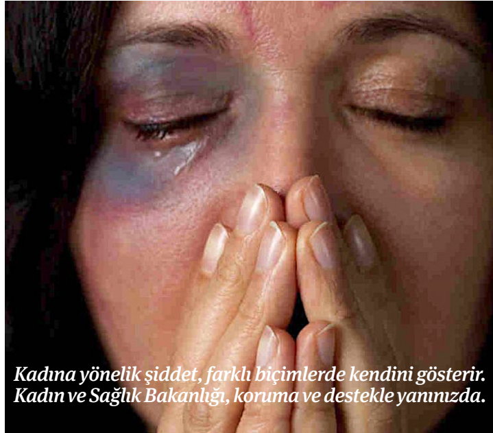
Kadına yönelik şiddet, farklı biçimlerde kendini gösterir. Kadın ve Sağlık Bakanlığı, koruma ve destekle yanınızda.