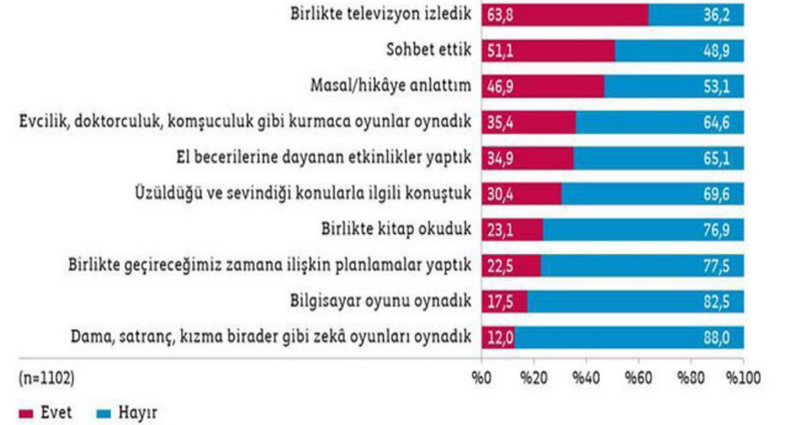
Şekil 5.1. Son bir ay içinde çocuğunuzla aşağıdakilerden hangilerini yaptınız? (0-3 yaş)