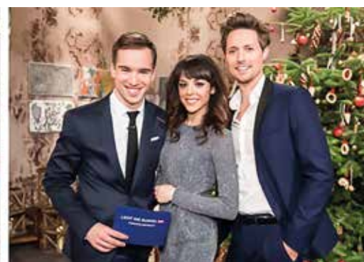
Alljährlich verwandelt sich das große Studio im ORF-Zentrum in die weihnachtliche Spendenzentrale: viele Prominente und Soldaten des Österreichischen Bundesheeres helfen mit. Führen durch die „Licht ins Dunkel“-Nachmittagssendung am Heiligen Abend: Andreas Onea, Marjan Shaki und Lukas Perman (v.l.n.r.)