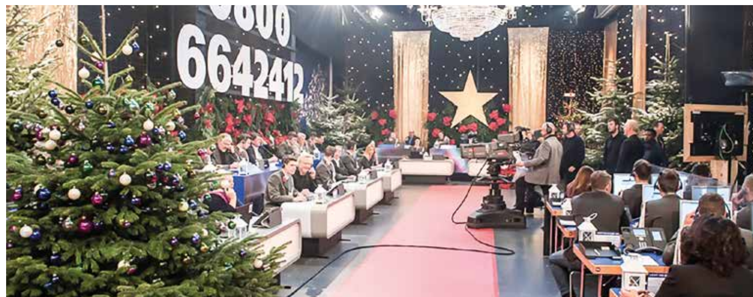
Der ORF führt 2017 zum 45. Mal die Aktion „Licht ins Dunkel“ zugunsten behinderter Kinder und Familien in Not in Österreich durch.

Eine Sendung zum Zweck des Spendensammelns für das Behindertendorf in niederösterreichischen Sollenau fand zum ersten Mal im ORF-Radio Niederösterreich am 24. Dezember 1973 statt. Das Spendenergebnis war mit 33.854 Schilling (2.400 Euro) überwältigend! Aufgrund des Erfolges wurde die Sendung in den folgenden Jahren an Weihnachten fortgesetzt.