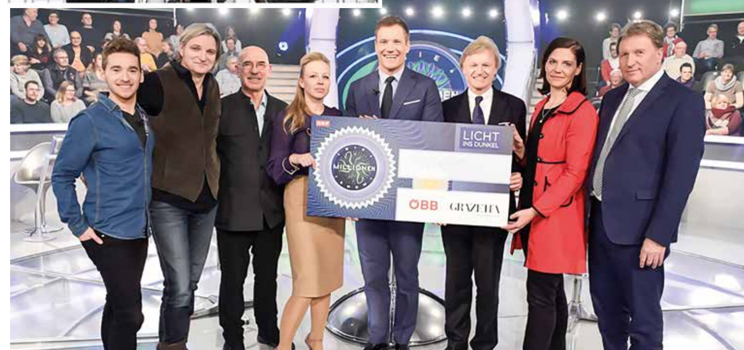
Armin Assinger (M.) präsentiert seit vielen Jahren die „Promi Millionen Show“ für „Licht ins Dunkel“, mit einem prominenten Rateteam für den guten Zweck.