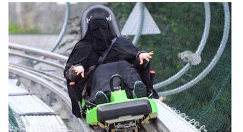
Dieses Bild soll es in Österreich ab diesem Sommer nicht mehr geben.

Das geplante Burkaverbot trifft vor allem arabische Touristinnen. Österreichs Hoteliers bangen um ihr weltoffenes Image und um eine konstant wachsende, ausgabenfreudige Klientel.