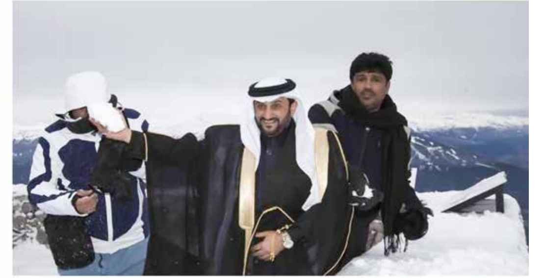
Auf dem Innsbrucker Hafelekar (2300 Meter) hatte Scheich al Obaikan (mi.) erstm.

Auf Einladung von Eurotours reiste ein saudischer Scheich durch Österreich. Arabische Gäste sollen für den Winter begeistert werden.