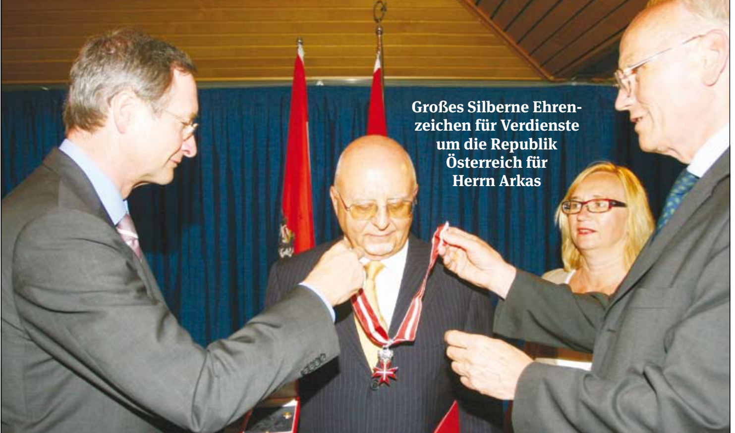
Großes Silberne Ehrenzeichen für Verdienste um die Republik Österreich für Herrn Arkas

Avusturya Devlet Nişanı alan Türk'ten önemli mesaj!