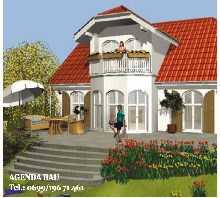
AGENDA BAU Tel.: 0699/196 71 461

Bugün hayalinizdeki ev yarınlarnın geleceğe dönük yatırımınıdır! Yaşamayı özlediğiniz bir ortamda kendi evinize sahip olmakla kazanılı bir yatırım yapmış olursunuz. Huzurunuz ve yaşam kaliteniz artar, beklediğiniz ev niteliklerine hemen kavuşursunuz.