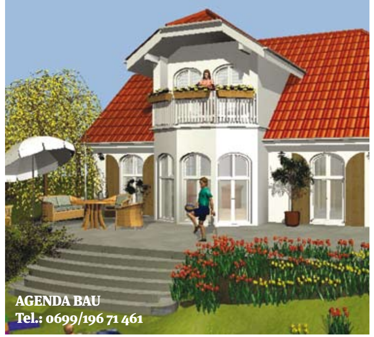
AGENDA BAU Tel.: 0699/196 71 461

Bugün hayalinizdeki ev yarınların geleceğe dönük yatırımınıdır! Yaşamayı özlediğiniz bir ortamda kendi evinize sahip olmakla kazançlı bir yatırım yapmış olursunuz. Huzurunuz ve yaşam kaliteniz artar, beklediğiniz ev niteliklerine hemen kavuşursunuz.