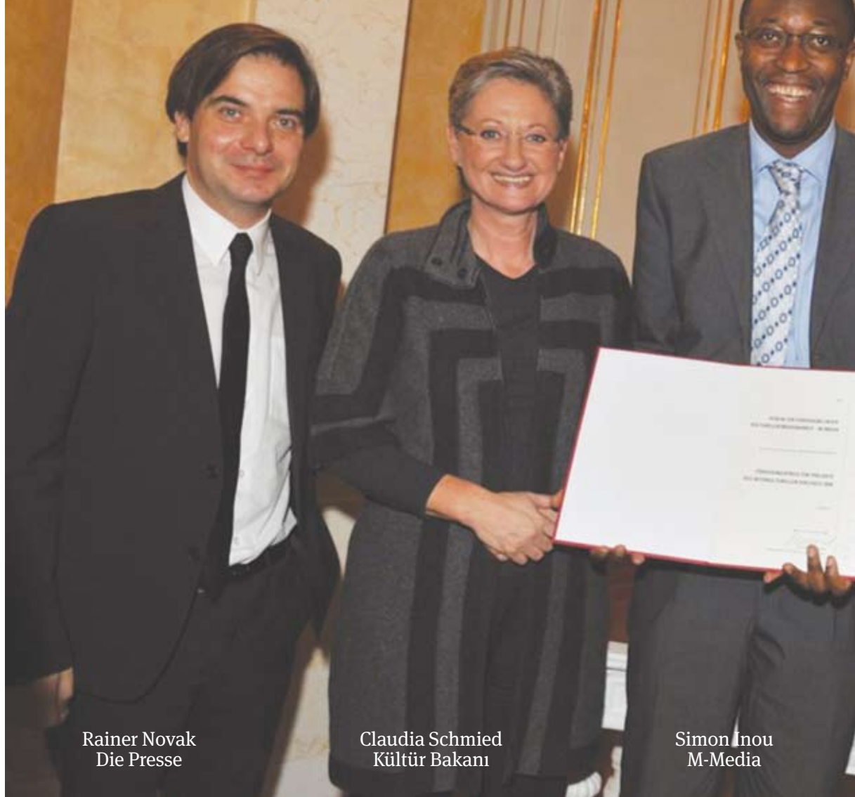
Rainer Novak Die Presse