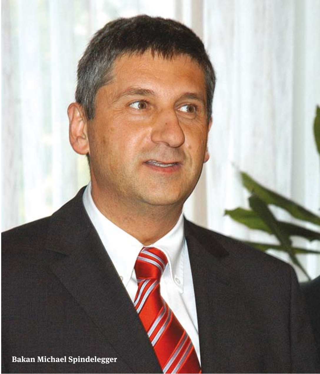
Bakan Michael Spindelegger

VİYANA- Standard gazetesinin Dışişleri Bakanı Michael Spindelegger ile yaptığı mülakatın Türkiye ile ilgili bölümü, yeni Avusturya Dışişleri Bakanının Türkiye'nin AB girişimlerine karşı çifte standart siyasetini devam edeceğini gösteriyor. Standar gazetesinde Spindelegger 'ÖVP, başka hiçbir AB antlaşmasını halka sunmak istemese de, Türkiye'nin katılımı konusunda bir referandum yapılması' fikrini savunuyor.