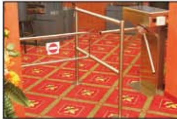
Giriş kontrol düzeni

Kayıt işleminden sonra oyuncuya üzerinde bir çip bulunan NOVOCARD™ verilir, oyun alanının girişindeki turnike sadece bu kartla açılır. Uygunsuz olarak kullanılan veya kaybolan kartların kodu derhal iptal edilir.