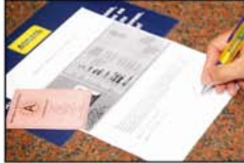
Kişisel bilgilerin kaydedilmesi

Otomat Salonu'na gelen her oyuncu, içeri girmeden önce kasada fotoğraflı yasal kimliğini gösterecektir. Oyuncunun erginlik yaşı kontrol edildikten sonra kişisel bilgileri skanner aracından geçirilip merkezi olarak yönetilen bilgisayara işlenir. Böylece Aşağı Avusturya'daki bütün Admiral Entertainment merkezlerinde bu verilerin kontrol edilmesi olanağı sağlanır.